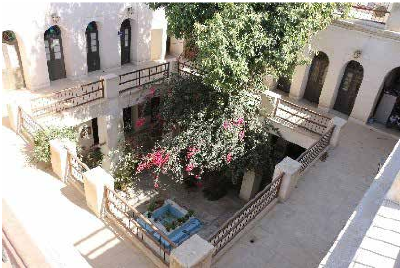
تصویر ۶. عقب‌نشینی در طبقات بالای خانه به منظور ایجاد فضای رابط.

علاوه بر گفته‌های بالا استفاده از شناسیر به عنوان رابط بین فضاهای خانه باعث ایجاد سایه اندازی بر روی حیاط مرکزی و جداره‌های خارجی خانه می‌شود. این سایه اندازی باعث ایجاد دماهای مختلف بر روی سطح دیوار و نتیجه آن ایجاد کوران در اطراف ساختمان است که این کوران‌ها چرخش بهتر هوا را به همراه دارند. از طرفی شناسیر با ایجاد ناهم‌واری در سطح جداره خارجی این کوران‌ها را تشدید می‌کند (تصویر ۷). ● ایجاد محرمیت : یکی از ویژگی‌های مهم معماری ایرانی توجه