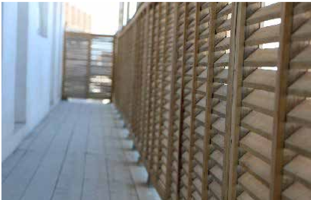
تصویر ۳. طول زیاد شناسیرها نسبت به عرض آنها.

است که طول شناسیرها گاهی به بیست متر هم می‌رسد که این تناسب برای محیطی که در آن وقت زیادی گذرانده شود غیرمعمول و غیرعقلانی به نظر می‌رسد (تصویر ۳).