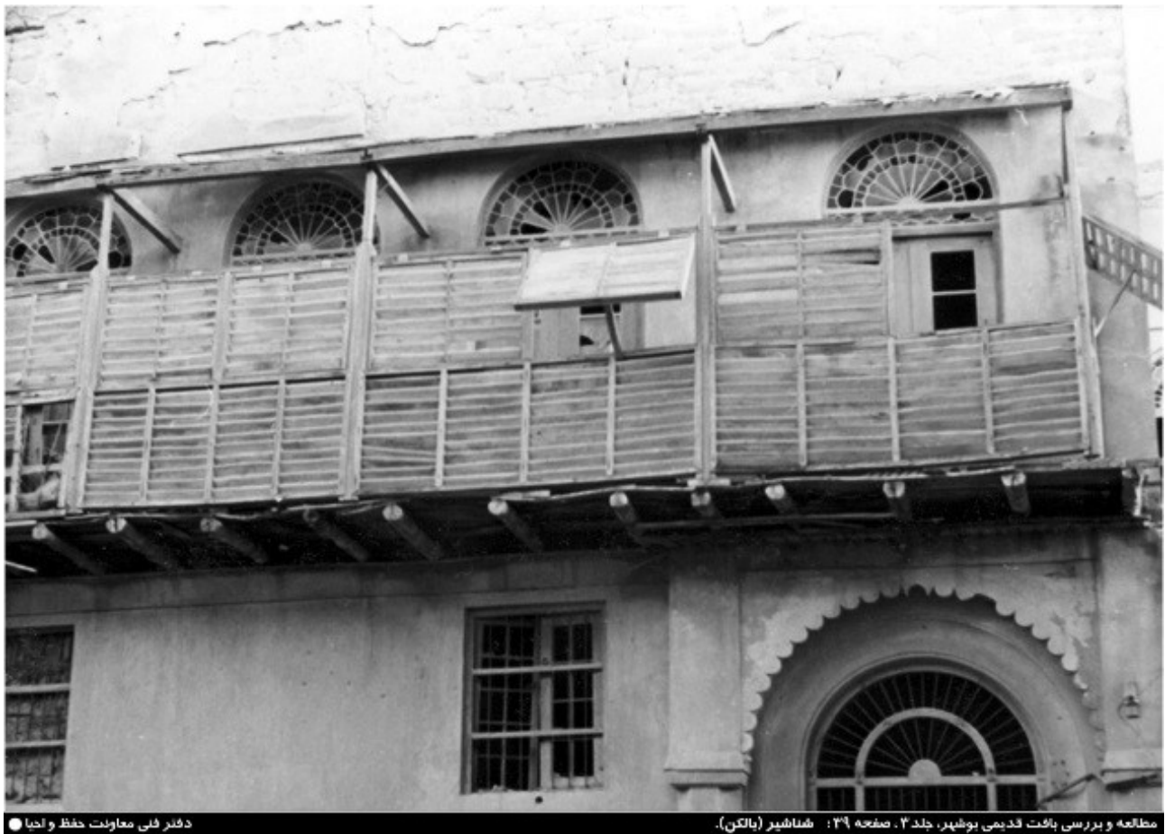
مطالعه و بررسی بافت قدیمی بوشهر، جلد ۳، صفحه ۳۹: شناسییر (بالکن).