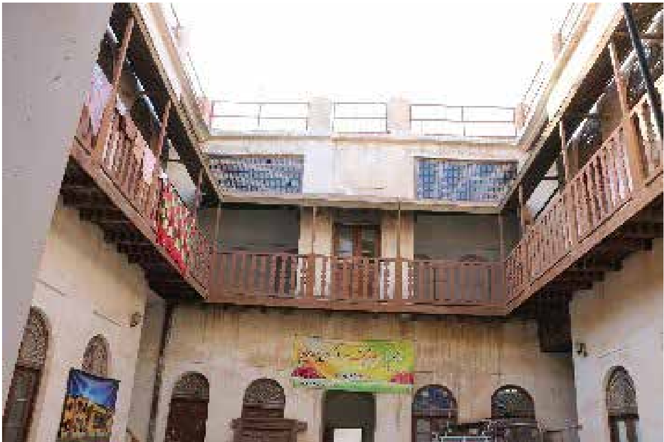
تصویر شماره ۷. پیش آمدگی شناسیها درون حیاط مرکزی.

انداختن هوا در محل زندگی شرایط بهتری را فراهم کرد. در این مواقع معماری نیز تلاش دارد شرایط را بهبود بخشد که در پژوهش‌های پیشین یکی از پاسخ‌های معماری را شناسی بیان کردند. گفته شده است که شناسی به دلیل ساختار فیزیکی، تهویه خوب و جریان یافتن هوا در آن، محل مناسبی برای زیستن است و ساکنان بخشی از اوقات خود را در تابستان در آن می‌گذرانند. وقتی از بعد عقلانی و با این دید که معماری یک پدیده چند بعدی است به این فرضیه می‌نگریم، در می‌یابیم که شناسی با این ابعاد غیر معقول خود هیچ‌گاه محلی برای گذراندن وقت نبوده است چرا که حتی عبور یک نفر هم در آن به سختی صورت می‌پذیرد و این نکته نیز بیان شد که اگر شناسی تنها یک عنصر اقلیمی بود، در دوره‌های بعدی و در چهار محله جدید بوشهر از معماری بومی بوشهر حذف نمی‌شد. از طرف دیگر وجود عنصر طارمه این فرضیه را که شناسی محلی برای زیستن بوده است را کاملاً رد می‌کند چرا که هر جا نیاز به فضایی برای استراحت و کاهش اثر شرجی وجود داشته، طارمه مورد استفاده قرار می‌گرفته است.