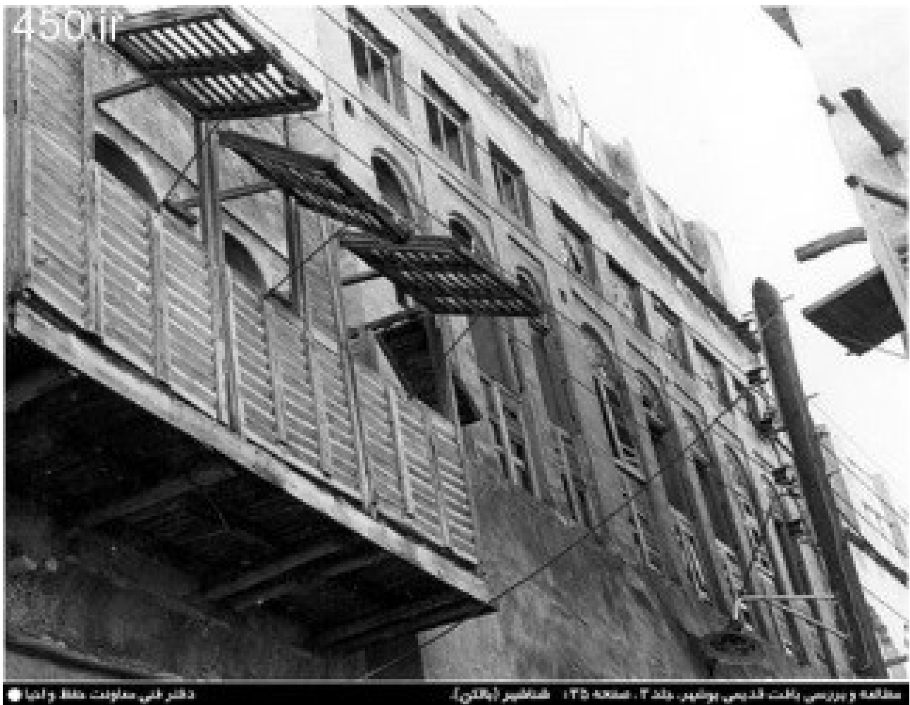
تصویر ۵ ساختار ایجاد ساختاری برای ایجاد امنیت و حریمیت.

خلاقانه به نیاز خود داده‌اند. این پاسخها در معماری خود را در قالب عناصر معماری نشان می‌دادند و کاربران سعی بر آن داشتند که این عناصر را به مرور زمان بهبود بخشند تا استفاده‌های دیگری نیز از آن بکنند و از جنبه‌های مختلفی از آن سود ببرند. با بیان این مسئله به بررسی دیگر ویژگی‌های عنصر شناسیر می‌پردازیم ولی این ویژگی‌ها بنا به دلایل ذکر شده به هیچ وجه دلیل وجودی این عنصر معماری نیستند. بلکه ساکنان خانه‌های بوشهری در کنار دلیل اصلی بیان شده در بالا از آنها بهره‌مند می‌شدند.