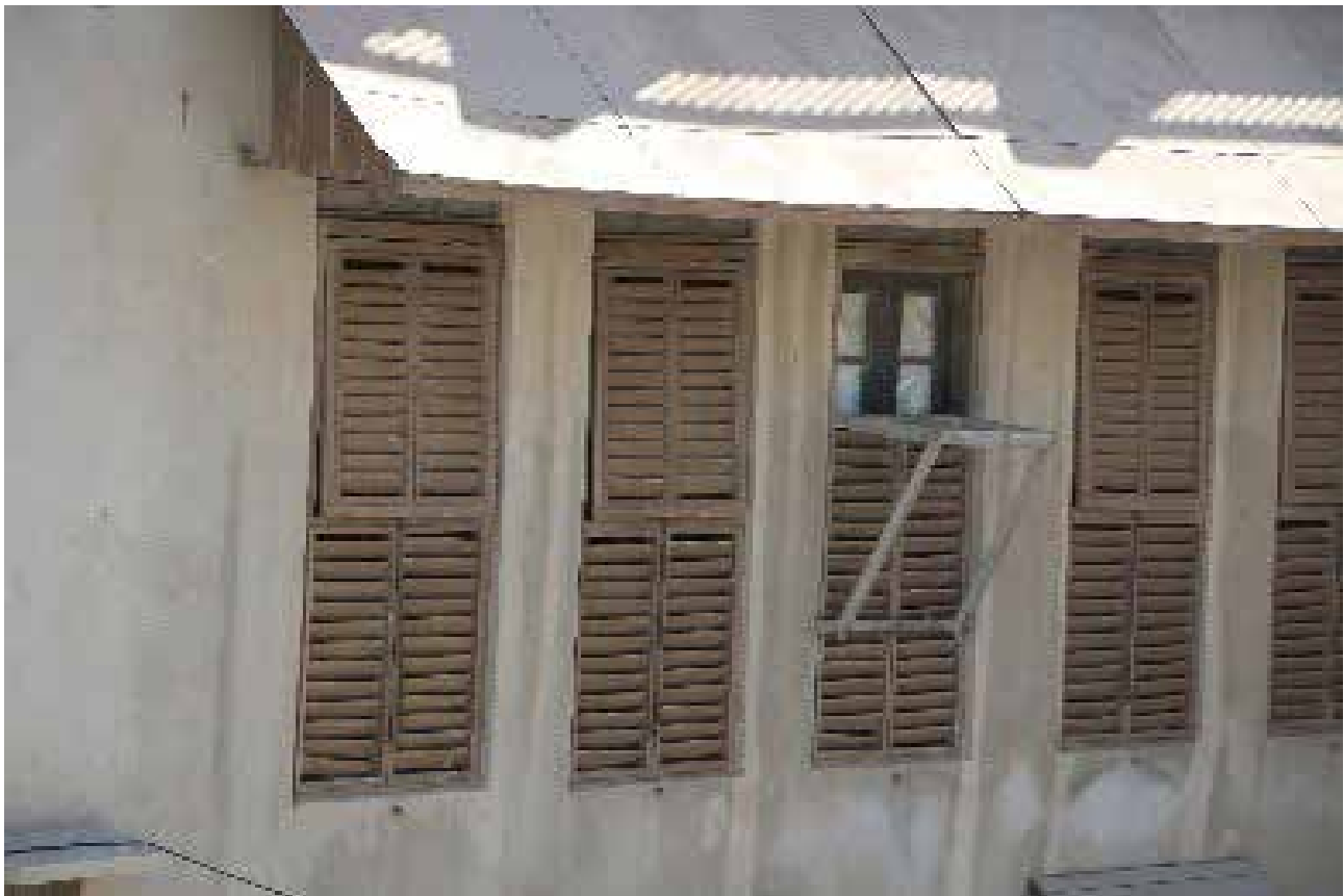
تصویر ۴. شباهت ساختار شناسی‌ها و بازشوهایی که در جلو خود شناسی‌ها ندارند.

بازشوهایی زیاد مانند ۵ دری و ۶ دری در خانه‌های بوشهری دلیل آن است. این بازشوها که ارتفاع آنها از سقف تا کف است در تمام طول روز در ماه‌های گرم سال باز هستند تا بتوانند جریان باد را وارد خانه کرده و اثر شرجی را کاهش دهند. باز بودن پنجره‌های قدی، خطرات بسیار زیادی را برای ساکنان به خصوص کودکان به وجود می‌آورد که برای تامین ایمنی آنها تا ارتفاعی از این پنجره‌ها را با کرکره‌هایی می‌پوشاندند ولی این کرکره‌ها جلوی باد را می‌گیرند و از شدت جریان آن می‌کاهند (تصویر ۵).