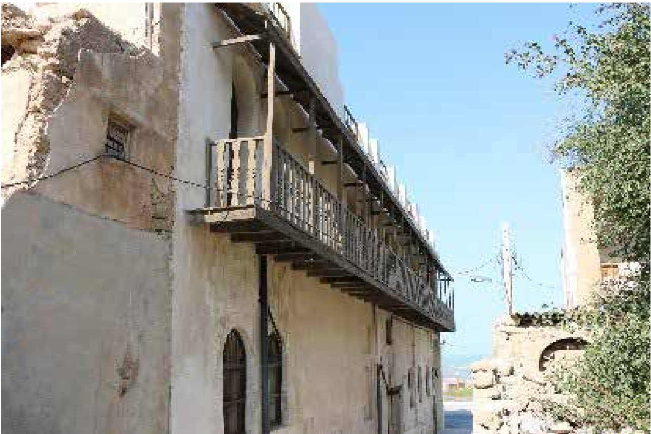
تصویر ۸. بدنه فاقد کرکرهی شناسیرها، شناسیر عمارت طاهری.