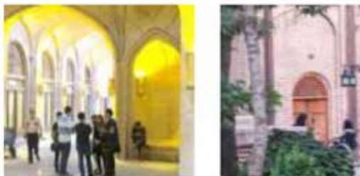
برخوردها و تعاملات اجتماعی برای تمامی اقشار جامعه