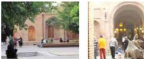
تمایل مخاطبان به حضور و گذارن اوقات فراغت در مجموعه