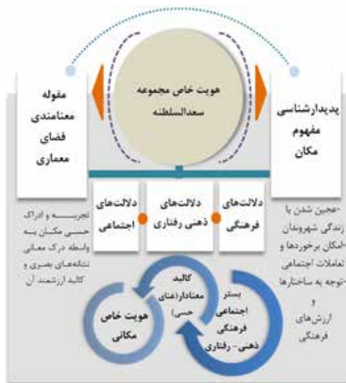
نمودار ۲. عوامل تأثیرگذار بر هویت خاص مجموعه تاریخی سعدالسلطنه.

در نتیجه مجموعه تاریخی سعدالسلطنه در انتقال گذشته تاریخی خود به شهروندان- در قالب کالبد معماری- به همراه پذیرش تجارب زیستی و فرهنگی آنان و عجین شدن با زندگی شهروندان قرار دارد. بدین ترتیب علاوه بر کارکرد معمارانه خود، در پی تحولات معنایی رخ داده در نحوه عملکرد آن در فضای شهری مانند پذیرش حضور شهروندان و آمیختگی با رویدادها و زندگی روزانه آنان، از معنای کالبدی خود فراتر رفته و در برخورد با دلالت‌های ذهنی- رفتاری، تاریخی، اجتماعی و فرهنگی به معنایی درخور تامل و توجه در مسیر دستیابی به هویتی پویا دست یافته‌است.