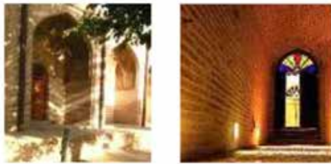
تجربه حسی - ادراکی