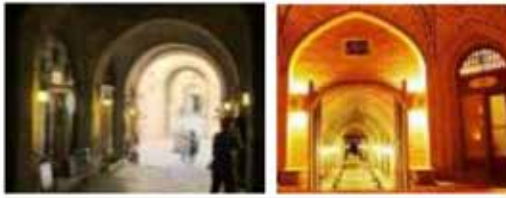
تمایل به تجربه فضا