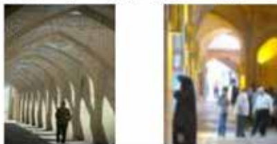
عنصری آشنا در ذهن شهروندان