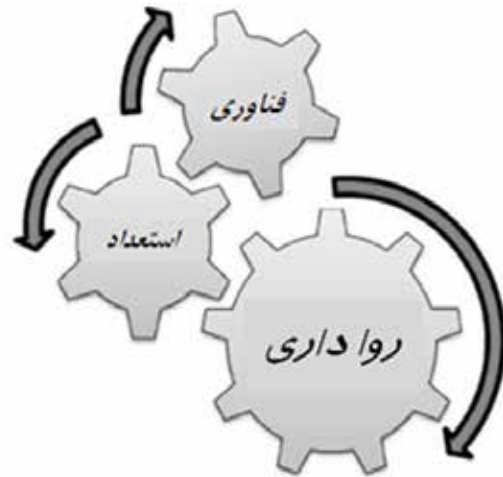
تصویر ۳. متغیرهای شهر خلاق.

در سطح بین‌المللی سازمان‌هایی نظیر سازمان آموزشی، علمی و فرهنگی سازمان ملل متحد ۸ با طرح شبکه جهانی شهرهای خلاق، سازمان همکاری و توسعه اقتصادی ۹ و کمیسیون اروپا ۱۰ نیز از این ایده در سیاستگذاری‌های خود استفاده کردند. البته زمینه پرداختن به ایده شهر خلاق در یونسکو را باید در سال ۲۰۰۱ و بیانیه جهانی تنوع فرهنگی، جستجو کرد که به دنبال نفی استانداردسازی فرهنگ تحت شرایط جهانی شدن بود (Sasaki, 2010). شبکه شهرهای خلاق یونسکو نشان دهنده پتانسیل بسیار بالای فرهنگ برای تقویت توسعه پایدار است. شهرها با پیوستن به این شبکه متعهد می‌شوند که با نگرش تقویت خلاقیت و صنایع فرهنگی، مشارکت را در زندگی فرهنگی ارتقا داده و فرهنگ را در طرح‌ها و استراتژی‌های توسعه اقتصادی و اجتماعی بگنجانند. گفتنی است دستور کار توسعه پایدار برای سال ۲۰۳۰ که سپتامبر سال ۲۰۱۵ به تصویب رسید، بر نقش فرهنگ و خلاقیت به عنوان اهرم‌های کلیدی برای توسعه پایدار شهری تأکید می‌کند. شاید اصلی‌ترین مزیت حضور در این شبکه را بتوان در افزایش آگاهی جهانی از ویژگی‌های منحصر به فرد هر یک از این شهرها دانست که در نهایت می‌تواند به افزایش سرمایه‌گذاری، استفاده بهینه از سرمایه‌های انسانی، رونق گردشگری داخلی و بین‌المللی و در نهایت رونق اقتصادی و فرهنگی این شهرها بیانجامد.