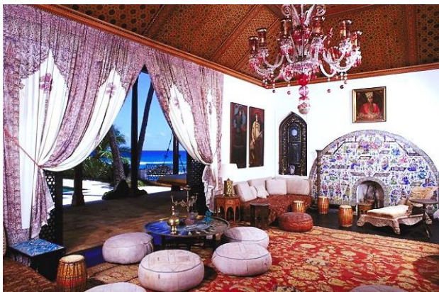
تصویر ۴. نمایی از اتاق نشیمن خانه دوریس دوک (اکنون موزه شانگری لا، بنیاد دوریس دوک) به همراه قاب کاشی شومینه موردنظر در سمت راست.

اجزای برجسته مختلف (قاب و حاشیه) است اما قاب کاشی شومینه محفوظ در موزه «شانگری لا» (چنانچه قائل به کاربری «شومینه» برای آن باشیم) نه تنها فاقد قاب‌بند‌های تزئینی و اجزای مذکور بوده، بلکه به‌طور کلی ساختار، ترکیب‌بندی و فرم متفاوتی دارد (تصاویر ۵ و ۶). این اثر با اینکه فاقد رقم (امضای هنرمند) یا هر نوع متن و کتیبه است، اما با استناد به قول اخیر (مکی‌نژاد، ۱۴۰۰، ۱۲۸) می‌توان زمان تقریبی ساختش را اواخر عصر ناصری یا دوره مظفری که دوران اوج تحولات کاشی‌کاری در عصر قاجار است، در نظر گرفت.