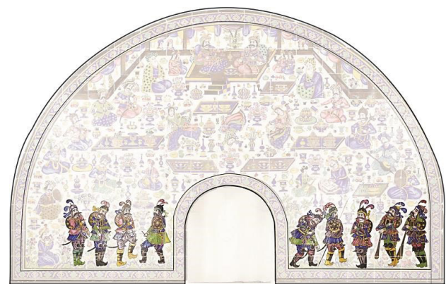
تصویر ۱۶. نظامیان و محافظان قاجاری در کسوت قزلباش‌های صفوی، در پایین‌ترین بخش هرم. مأخذ: نگارندگان.