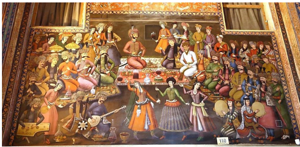
تصویر ۳. دیوارنگاره مجلس پذیرایی شاه عباس دوم از ندرمحمدخان (پادشاه ترکستان، کاخ چهلستون، اصفهان، مآخذ: آرشیو نگارندگان).