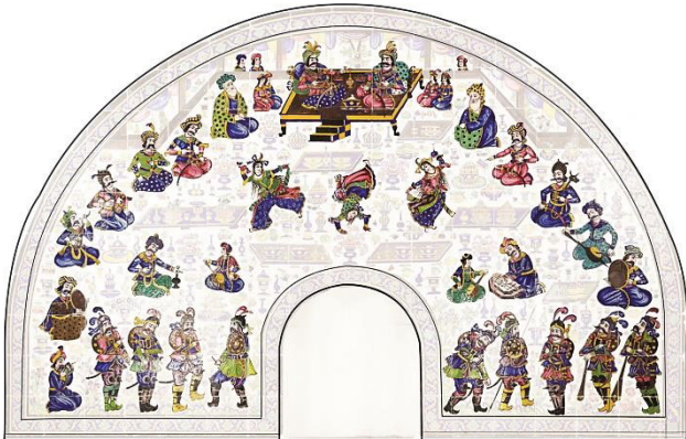
تصویر ۷. شمایی از کل افراد حاضر در صحنه (۳۷ نفر).