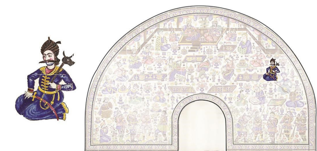
تصویر ۱۷. رستم در کسوت یک رجل صفوی با پوشش و آرایش خاص همان دوره.

امتداد دیگر درباریان نشسته و به تبعیت از سایر افراد و مقامات، او نیز جامه و دستار صفوی دارد و فقط گرایش عامل تشخیص هویت اوست. طبق سنن تصویرگری قاجار، رستم در خارج از کارزار و در بارگاه‌ها، از جمله در همین بزم تشریفاتی و موارد دیگری مثل بارگاه سلیمان، معمولاً در حالت نشسته و بی‌تحرك مجسم می‌شود. در اینجا او بالاتر از نوازندگان و رامشگران و پایین‌تر از درباریان قرار گرفته است؛ از این رو می‌توان جایگاهش را نه در حد درباریان طراز اول و نه در حد خنیاگران پایین‌دست، بلکه در موقعیتی بینابین قلمداد کرد. در حقیقت با توجه به اینکه در این کاشی‌نگاره از پرسپکتیو مقامی استفاده نشده، جایگاه و مرتبه هر یک از افراد با نحوه جای‌گذاری و سطح‌بندی آنها و