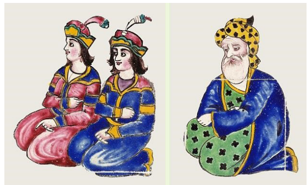
تصویر ۱۵. برخی از شخصیت‌های اطراف تخت پادشاه، شامل قضات، مقامات، نخبگان و شاهزادگان.

موضوع این قاب کاشی مشخصاً فضای دربار و یک بزم و پذیرایی شاهانه بوده و افراد حاضر در صحنه در سه سطح یا سه تراز متوالی آرایش یافته‌اند که عمدتاً شامل نظامیان، رامشگران و هسته اصلی قدرت می‌شوند. این ترکیب‌بندی خاص و جایگاه و مرتبه هر یک از افراد حاضر در آن که با نحوه جای‌گذاری و سطح‌بندی آنها مشخص شده، شکل یک مثلث و در نهایت هرم قدرت و سلسله‌مراتب آن را تداعی می‌کند. این سطح‌بندی و مرتبه‌گذاری، مفاهیم عمده‌ای را در حوزه سیاست‌مداری و قدرت در بردارد که در مجموع برآمده از نظام فکری حاکم بر روند سفارش و تولید آثار هنری در عصر قاجار و نوع نگاه آنان به این قضیه است. در اینجا شخص پادشاه به‌عنوان زمامدار مطلق امور در رأس هرم قرار گرفته و هریک از مقامات و ارکان دیگر حکومت، شامل شاهزادگان، مقامات، دولتمردان، اهل حرم و لشکریان که در مجموع