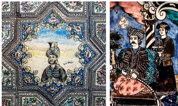
تصویر ۲. کاشی‌نگاره شومینه با نقش شاه عباس و ملازمش، موزه اولانا، آمریکا، مربوط به دوره قاجار (راست)؛ کاشی مقبره خانوادگی استاد لرزاده با تک‌چهره شاه طهماسب صفوی، مربوط به دوره قاجار، شهر ری (چپ). مأخذ: مکی‌نژاد، ۱۴۰۰، ۷۳.