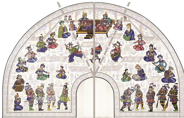
تصویر ۸. ترکیب‌بندی و اصل تقارن (از محور عمودی) در قاب کاشی.