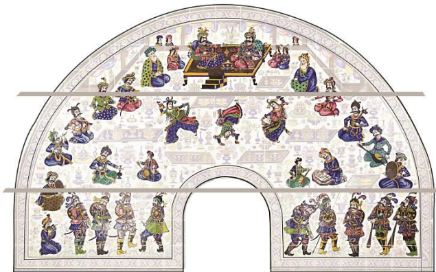
تصویر ۹. سه تراز لحاظ‌شده در چینش اجزاء و افراد حاضر در صحنه.

می‌کنند. این افراد در یک ترکیب‌بندی متقارن (از محور عمودی) مجسم شده و در نگاهی کلی در سه سطح یا تراز مختلف آرایش یافته‌اند که به ترتیب از پایین به بالا عبارتند از: (۱) نظامیان یا محافظان، (۲) رامشگران، خنیاگران، رقصندگان و (۳) پادشاه، رجال، صاحب‌منصبان، ملازمان و مقربان (تصاویر ۷، ۸ و ۹). در لابه‌لای این گروه‌های سه‌گانه و در فضاهای سفیدرنگ زمینه، عناصر تزئینی فراوانی نقش بسته که عمدتاً شامل میوه، جام، گلدان، صراحی، تنگ، ظرف و میزهای پایه‌کوتاه می‌شوند. در بخش پایین اثر هم در میان سربازان محافظ، انواع نقوش گیاه و گل (داوودی، زنبق، لاله، انار) و یک پرنده، در فواصل معین ترسیم شده است. در این تصویر، آبی، زرد، سبز و قرمز رنگ‌های غالب را تشکیل می‌دهند و کل قاب را یک حاشیه تزئینی که نقوش اسلیمی و ختایی ساده دارد در بر گرفته است. مؤلفه‌های فوق را می‌توان خلاصه‌وار در جدولی مانند نمونه زیر آورد (جدول ۱).