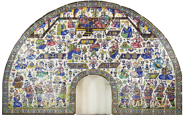
تصویر ۵. قاب سرامیکی شومینه، کاشی زیرلعابی، موزه «شانگری‌لا»، هاوایی، دوره قاجار.

قاب کاشی مذکور اگرچه ظاهراً در نقش پوشش یک عنصر کاربردی در معماری داخلی (شومینه) عمل کرده و مجموعه‌ای از آرایه‌های بصری را به نمایش می‌گذارد، اما تلفیقی از عناصر متفرق و در عین حال هماهنگ بوده و مفاهیم عمده‌ای را در بطن این ترکیب‌بندی دارد که برآمده از نظام فکری حاکم بر روند سفارش و تولید آثار هنری در عصر قاجار است. با توجه به نمونه‌تصاویر مشابه ارائه‌شده در بالا (تصویر ۳) موضوع این قاب کاشی، ملاقات و پذیرایی یکی از شاهان صفوی (احتمالاً شاه طهماسب یا شاه عباس دوم) از یک میهمان خارجی است؛ هرچند برخلاف نمونه‌های دیگر، در اینجا اختلاف چندانی در سیمای جامه و متعلقات شاه و میهمان مشاهده نمی‌شود و گویی هر دو یک پادشاه از یک ملیت هستند. نظر به اینکه در تصاویر مشابه به‌جای‌مانده، همواره پادشاه ایران در حال پیشکش کردن پیاله یا میوه به میهمان خویش است، در این نگاره هم شخص سمت چپ را می‌توان میزبان در نظر گرفت.