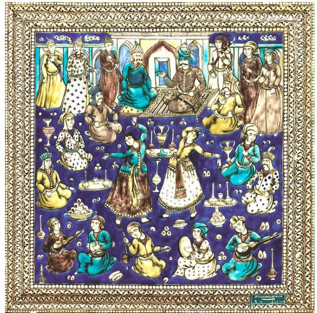
تصویر ۱۰. کاشی‌نگاره ملاقات شاه عباس با عبدالؤمن خان ازبک، گنجینه کاخ گلستان، دوره قاجار. مأخذ: مکی‌نژاد، ۱۴۰۰، ۱۰۳.

اتکا به پشتوانه‌های صفوی و اقتباس از عناصر هنری آن دوره، مسئله قابل‌توجهی است که نه تنها در قامت پیکرهای حاضر در این کاشی‌نگاره تجلی یافته، بلکه حتی ظاهر رستم، پهلوان شاهنامه را هم بی‌نصیب نگذاشته است (تصویر ۱۷). در اینجا برخلاف دیگر تصاویر قاجاری این اسطوره که عموماً در هیئت فتحعلی‌شاه قاجار است ۵ ، رستم در کسوت یک رجل صفوی و در