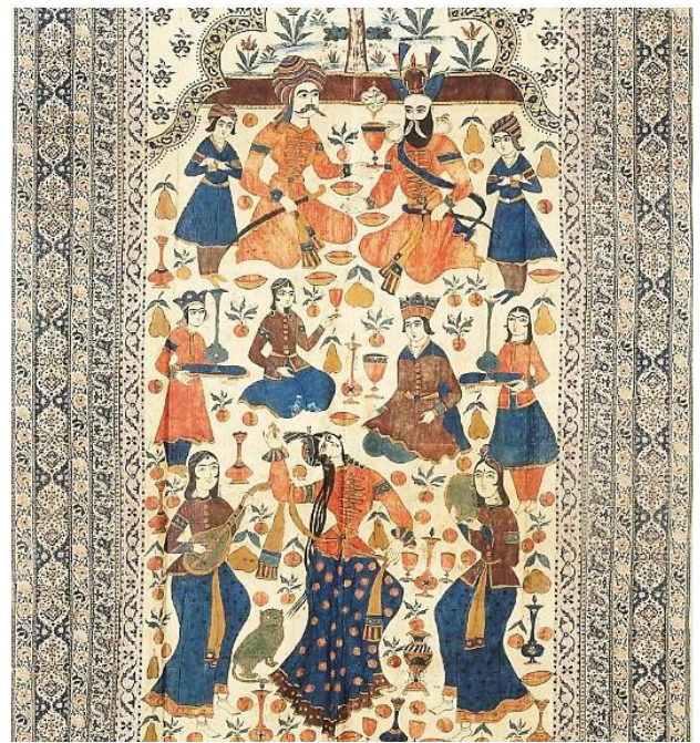
تصویر ۱۱. پارچه قلمکار با موضوع ملاقات و پذیرایی پادشاه صفوی از یک میهمان، دوره قاجار، مجموعه خصوصی.