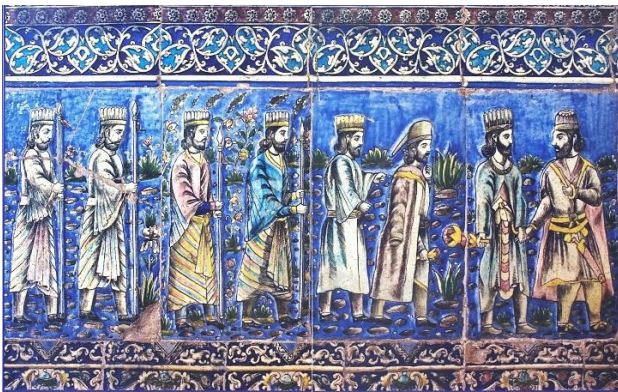
تصویر ۱. قاب کاشی با صحنه بارعام داریوش (با الهام از حجاری‌های تخت جمشید)، تالار آینه کاخ گلستان، دوره قاجار.