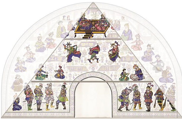
تصویر ۱۳. بازسازی فرم هرم قدرت و سلسله‌مراتب آن در قاب کاشی شومینه.