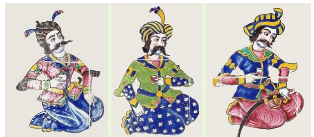
تصویر ۱۲. نمونه‌هایی از شخصیت‌های قاب کاشی شومینه با آرایش، جامه و دستار صفوی.