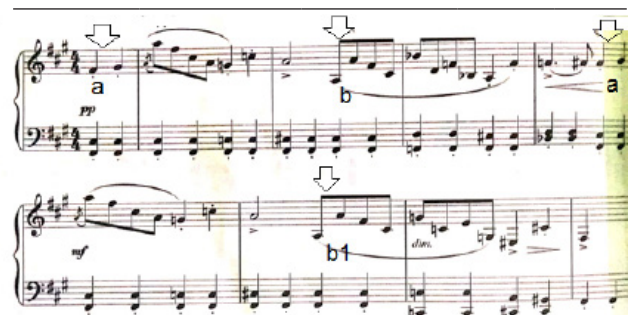
تصویر ۲. نمونه‌ای از پیوند با فرم ab a1b1 .