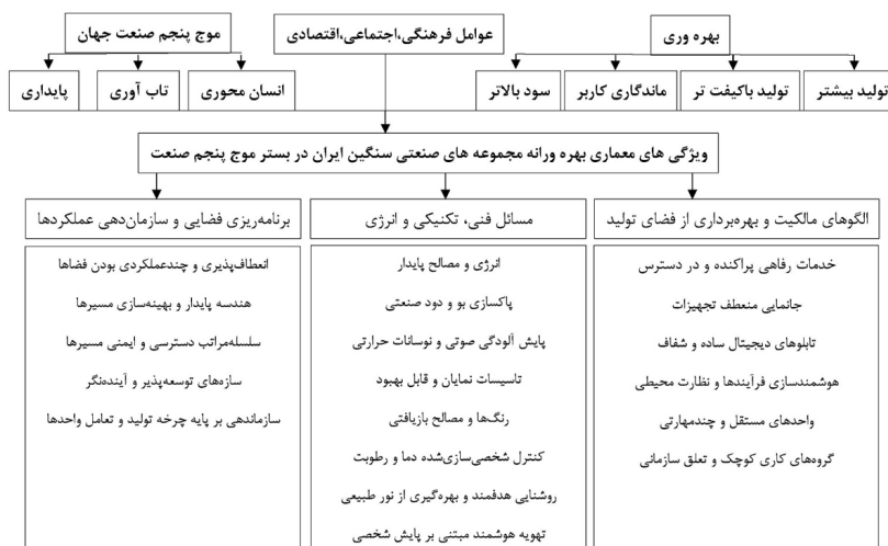
تصویر ۲. جمع بندی یافته ها.

باید با چرخه تولید هماهنگ باشد تا حرکت مواد در کوتاه ترین راه انجام گیرد و ازدحام و اتلاف نیرو کاهش یابد.